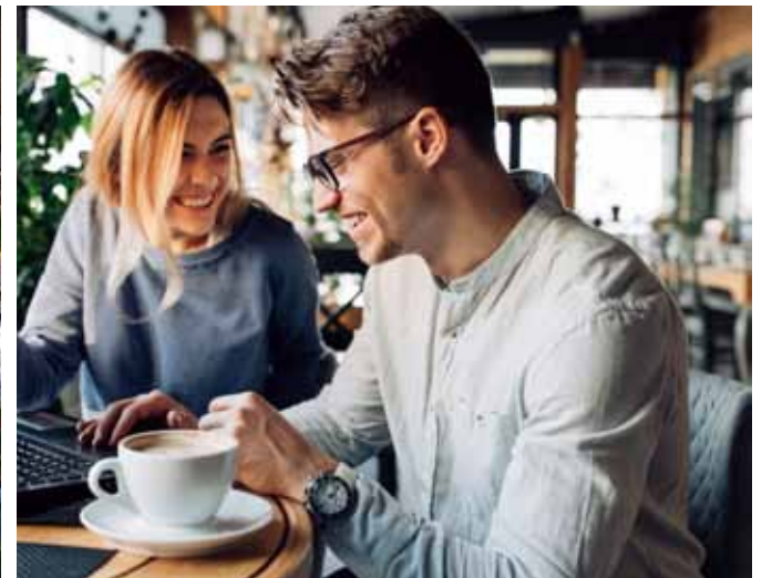
Bombardino Botanik, Lublin