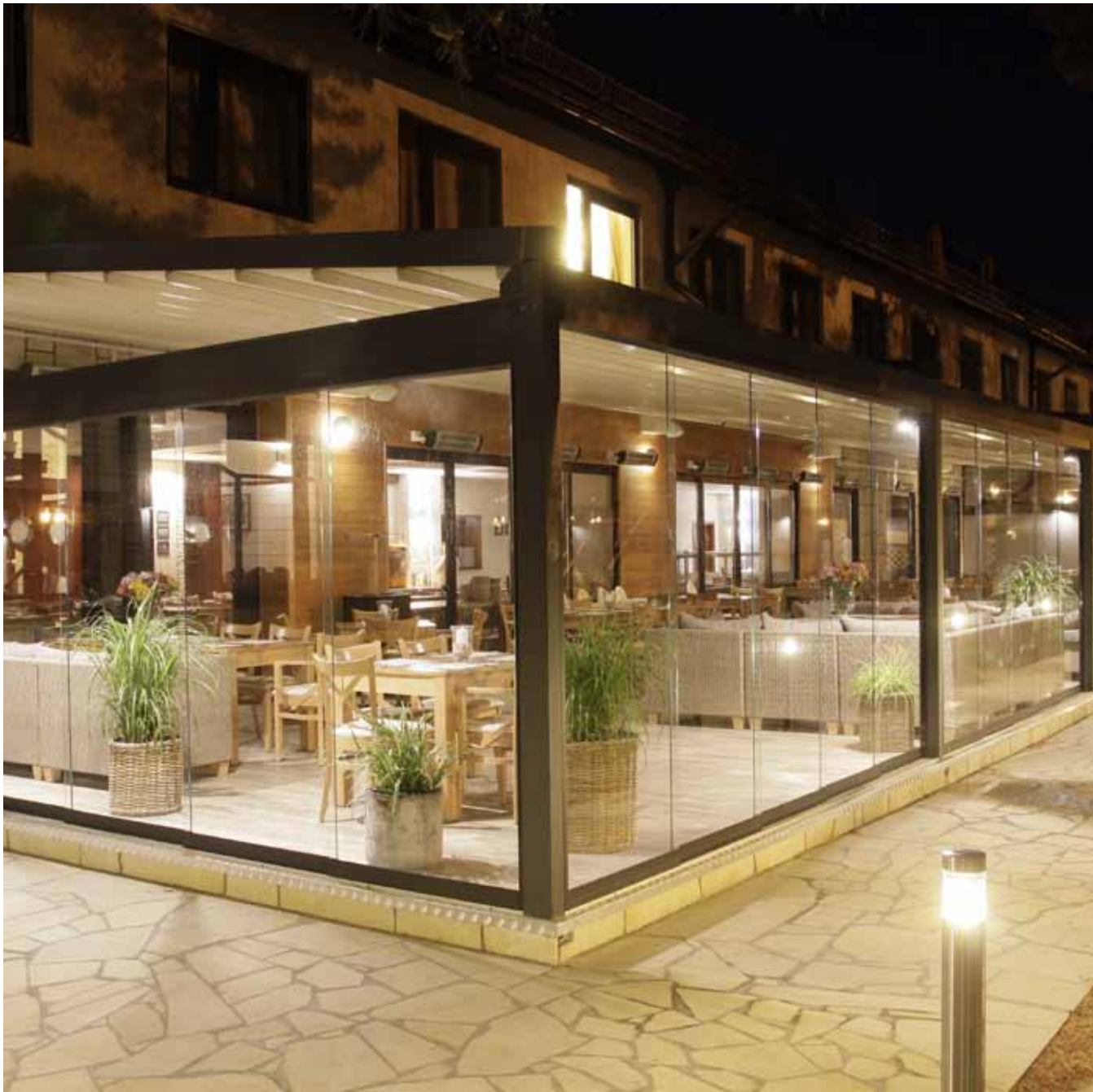
Hotel Columbus, Rowy