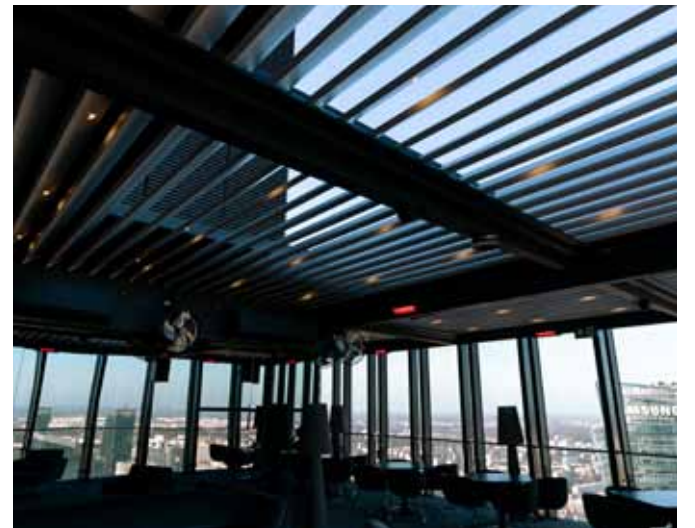
Skyfall Warsaw, Warsaw Unit