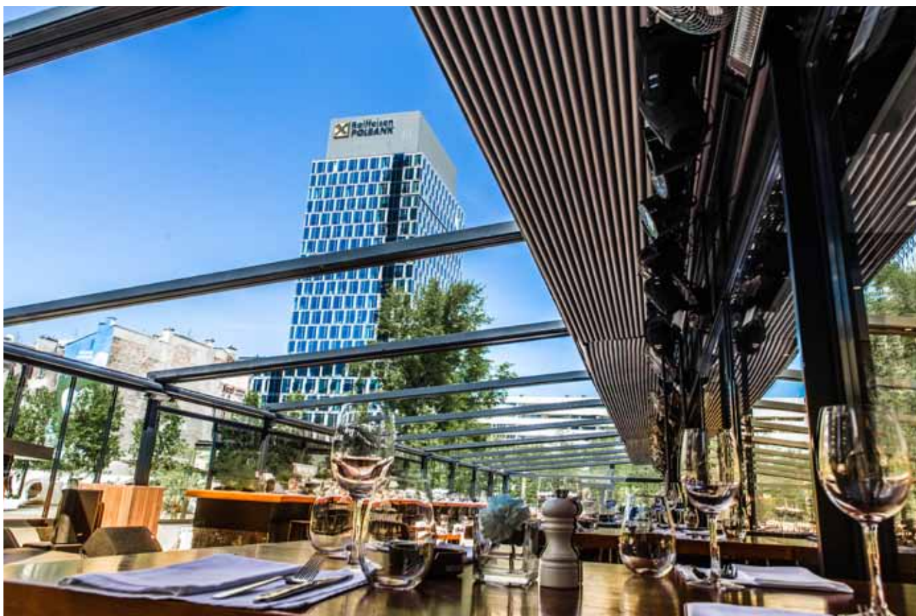
STIXX Bar&Grill, Warszawa