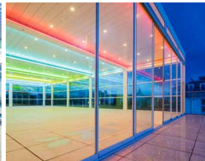
Galeria Promenada, Świnoujście