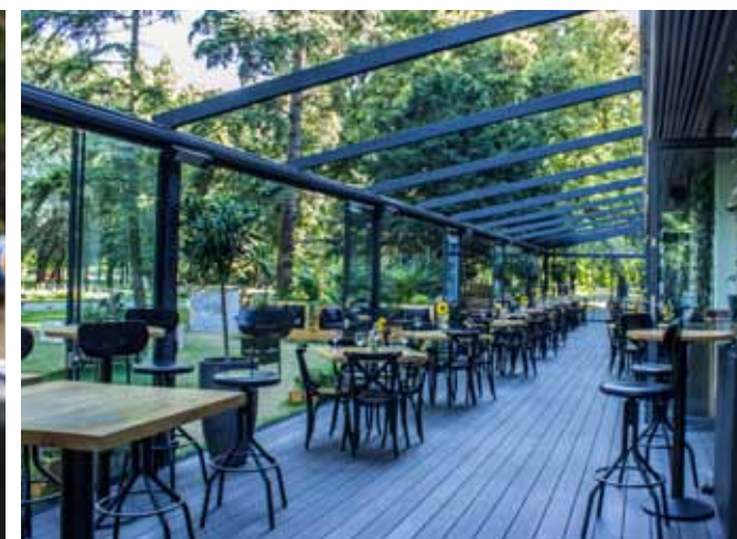
Na Lato, Warszawa