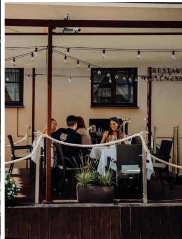
Hotel Alter *****, Lublin