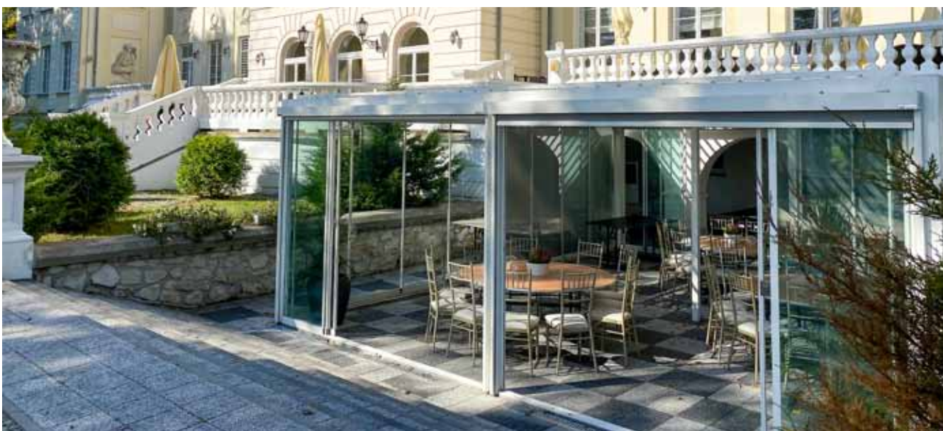
Hotel Pałac Alexandrinum ****, Poświętne